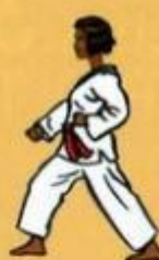
04 Are Maki Oren Ap Goubi Sogul