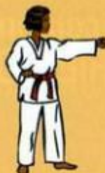
03 Mejomok Nerio Tchigul Owen Sogul