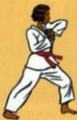
18 Palkoup Mom Tong Dollo Tchigul Owen Ap Goubi Sogul