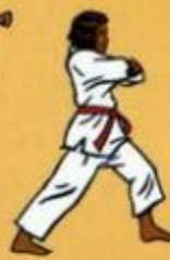
34 Oren Palkoup Mom Tong Pyo Yok Tchigul Owen Ap Goubi Sogul