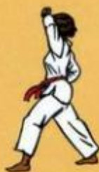
29 Eul Goul Maki Owen Ap Goubi Sogul