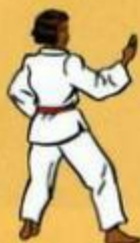
17 Hann Sonnal Mom Tong Bakat Maki Owen Dult Goubi Sogul