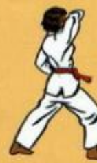
32 Eul Goul Maki Oren Ap Goubi Sogul