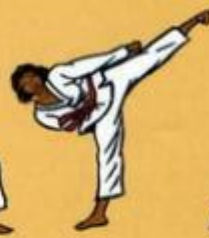
33 Yop Tchagul avec Are Maki