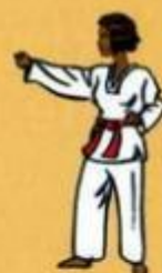
05 Mejomok Nerio Tchigul Oren Sogul