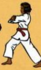
31 Owen palkoup Mom Tong pyo Yok Tchigul Oren Ap Goubi Sogul