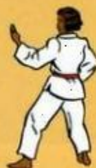
15 Hann Sonnal Mom Tong Bakat Maki Owen dult Goubi Sogul