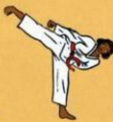
30 Yop Tchagul avec Are Maki