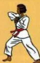
16 Palkoup Mom Tong Dollo Tchigul Oren Ap Goubi Sogul