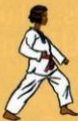
02 Are Maki Owen Ap Goubi Sogul